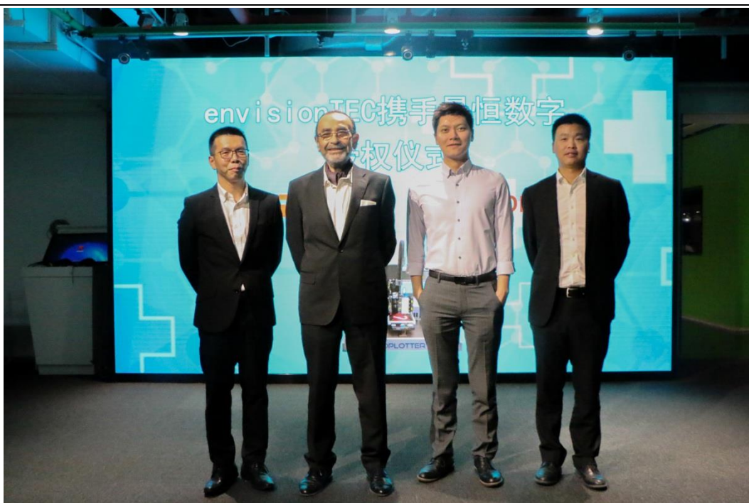
(曼恒数字 3D 打印业务部高层与 envisionTEC 公司高层合影)

曼恒数字专注于生物 3D 打印技术的应用及推广，此次与德国 envisionTEC 公司开展的战略合作，将进一步推动生物 3D 打印技术在国内的发展，为广大材料科学和组织工程的科研用户提供世界领先的 3D 打印技术解决方案，推动以组织工程学为代表的国内生命科学研究的不断进步，并为国内的医疗行业和国民健康做出卓越贡献。